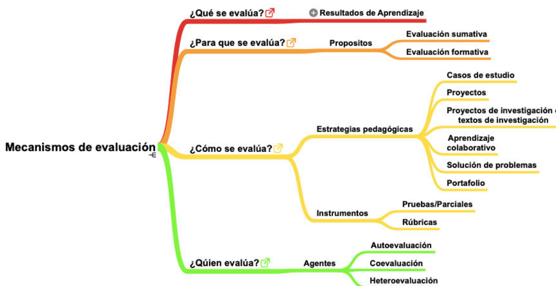
Gráfico 21. Mecanismo de evaluación del programa

Los propósitos de la evaluación de estudiantes se encuentran determinados por la evolución formativa y sumativa. En la primera, el objetivo es monitorear el aprendizaje del estudiante para proporcionar retroalimentación continua; puede ser utilizado por los profesores para impulsar su práctica profesor y por los estudiantes para mejorar su aprendizaje; ayuda a los estudiantes a identificar sus fortalezas y debilidades y los problemas y áreas que necesitan mejorar; posibilitan que los alumnos tengan una retroalimentación sobre el trabajo o la actividad objeto de evaluación. La segunda, la evaluación sumativa, establece balances fiables de los resultados obtenidos al final de un proceso de enseñanza-aprendizaje; pone el acento en la recogida de información y en la elaboración de instrumentos que posibiliten medidas fiables de los conocimientos a evaluar. El quien evalúa los diferentes encuentros pedagógicos está motivado por la autoevaluación, la coevaluación y la heteroevaluación.